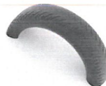
Vinci Play Egyenes mérleghinta - ST0524