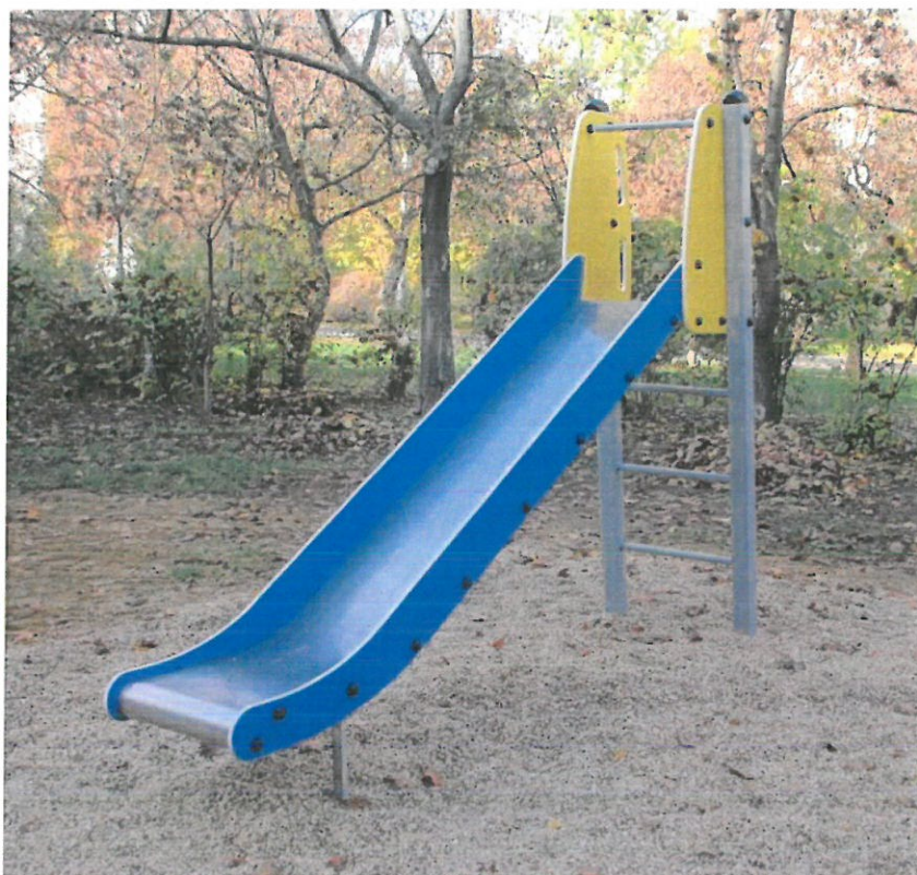
Vinci Play Csúszdaállvány csúszdával - 0832 (150cm-es beülési magassággal)